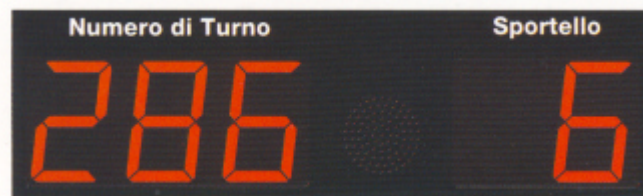
SISTEMA MULTISERVICE CON MESSAGGIO VOCALE