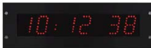
VERSIONE DA INCASSO